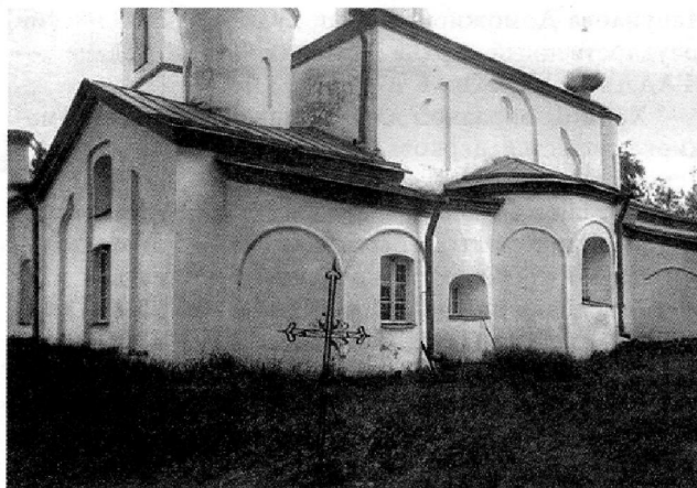
Ил. 7. Церковь Св. Троицы. Вид на восточный фасад и придел св. Параскевы. 1900-е г.

В годы Великой Отечественной войны на территории бывшего Гдовского уезда фашистами были варварски уничтожены три псковских храма: цер-