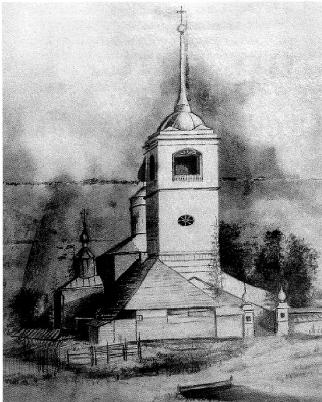
Ил. 2. Церковь Святой Троицы до пожара 1900 г.

два придела. Организацией же строительства занимался псковский воевода Ждан Андреевич Вешняков, участвовавший в штурме города Сыренска 8 . Именно он выбрал село Доможирку, как место для возведения храма. Он же, надо полагать, указал храм-образец — определил архитектурный облик Троицкой церкви 9 . Наконец, Ж. А. Вешняков, видимо, изменил посвящения приделов. Южный придел был освящен во имя св. мц. Параскевы 10 .