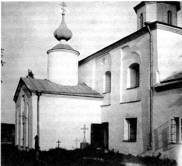
Ил. 6. Церковь Святой Троицы. Северный фасад храма и Никольский придел. 1907 г.