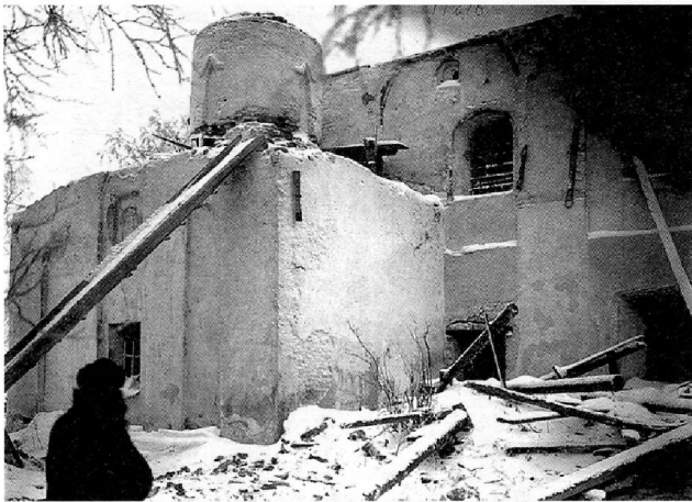
Ил. 5. Церковь Св. Троицы. Вид на Никольский придел и северный фасад. 1902 г..

части церкви: крыши, весь внутренний церковный наряд и архив» 33 . Не тронутой огнем, по сообщению прихожан храма, осталась только алтарная часть в приделе св. Параскевы, но и она требовала значительного ремонта, который был сделан «к празднику Рождества Христова» 34 .