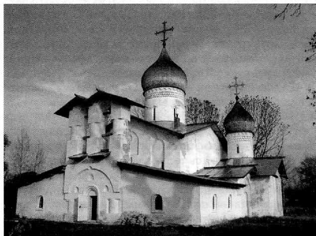
Ил. 1. Церковь Святой Троицы. 2007 г.

Храм в Доможирке был возведен по случаю успешного штурма русскими войсками города Сыренска в июне 1558 г. Заказчиком, как повествует Никоновская летопись, являлся сам Иван Грозный. Он дал средства на строительство и повелел: освятить храм во имя Живоначальной Троицы и построить